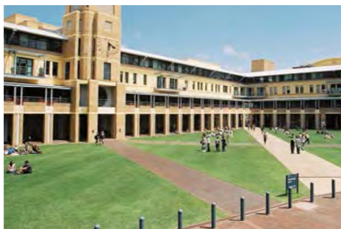
Campus de l'université du Queensland, Brisbane.

Les universités australiennes reconnaissent le système européen de transfert et d'accumulation de crédits. En général, un semestre d'études en Australie à temps plein représente environ 30 ECTS. Notez que cela dépend de la politique de chaque faculté australienne. Elles ont en effet des systèmes de notations (en Crédits) et d'équivalences ECTS qui peuvent varier.