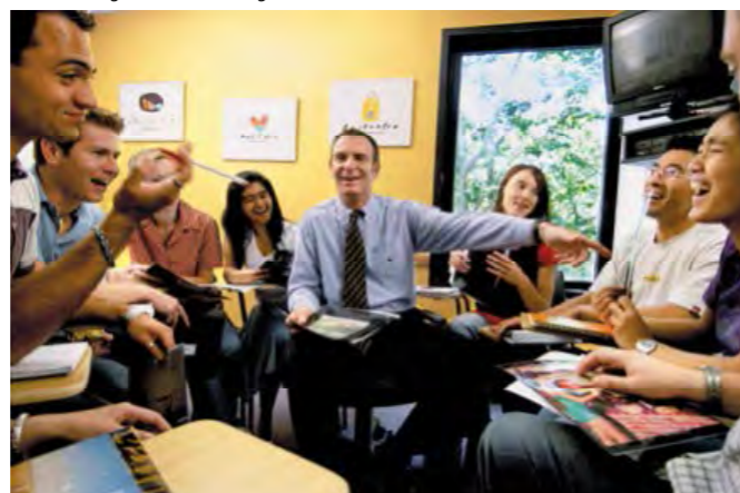
Centre de langues Shafston College, Brisbane.