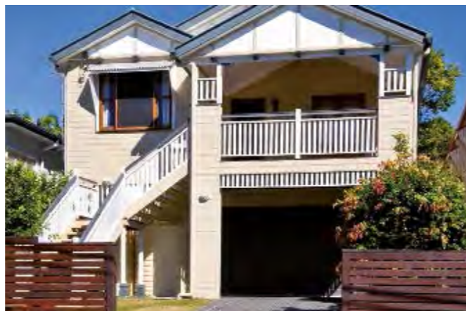
Une maison en bois typique de l'état du « Queensland ».