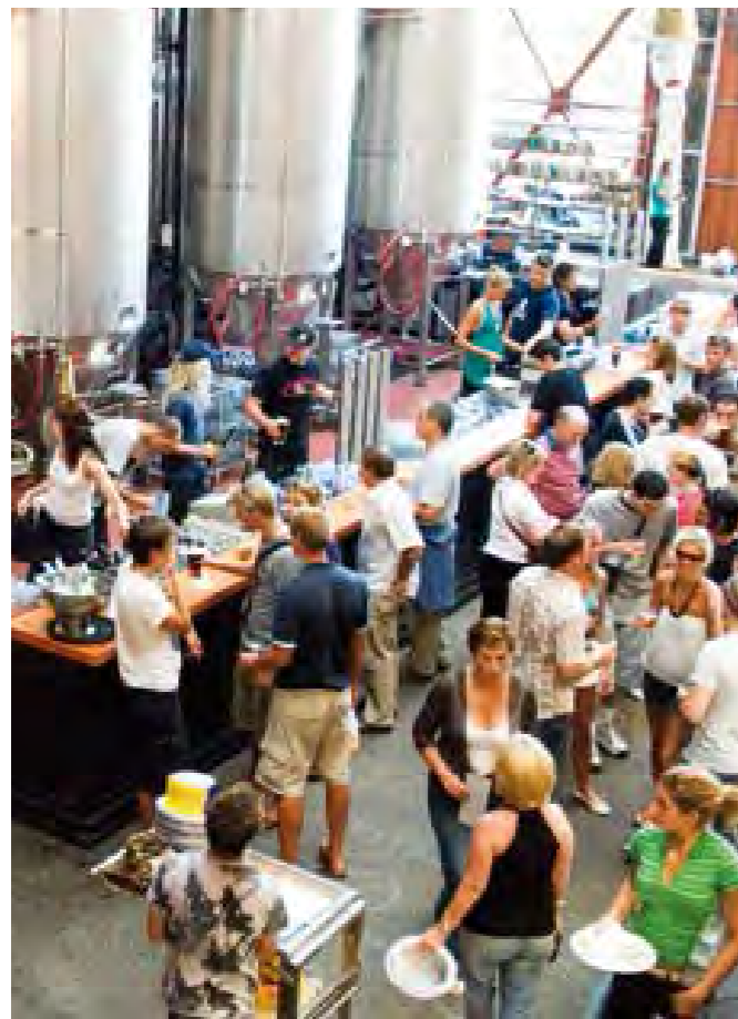
Soirée étudiante organisée par FAE, Perth.