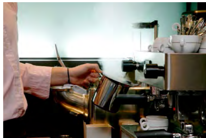
Un étudiant prépare un cappuccino.