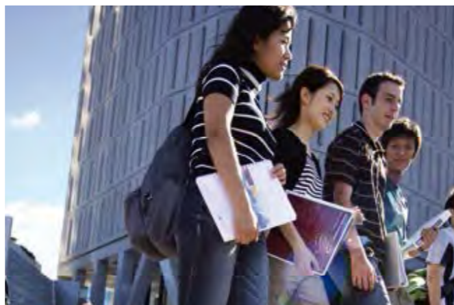
Étudiants internationaux dans le centre ville de Brisbane.

Rien de plus simple. Vous pouvez facilement ouvrir un compte en banque en Australie et obtenir une carte de crédit locale. Le bureau international de votre université vous expliquera les démarches à suivre.