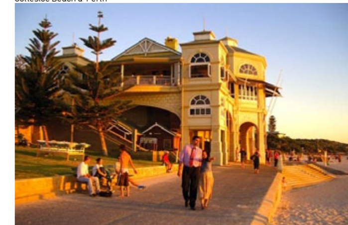
Cottesloe Beach à Perth

Pour vous inscrire, veuillez contacter une conseillère Francaustralia afin de recevoir le dossier de candidature. Une fois les formulaires reçus par nos services, un entretien skype en anglais sera organisé afin valider votre dossier.