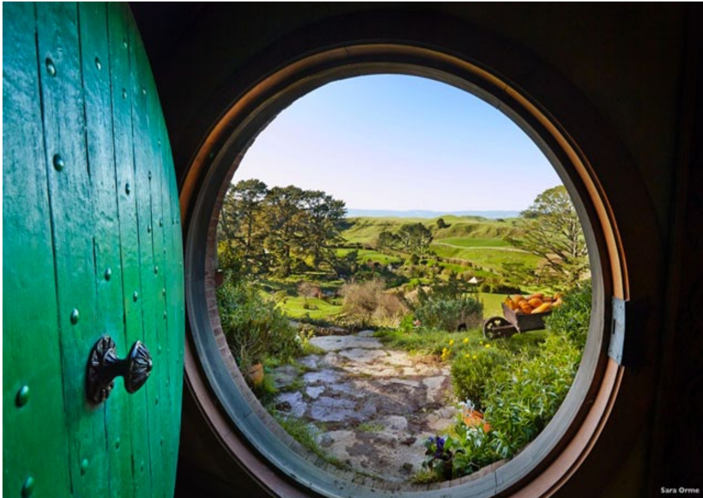
Village des Hobbits, Nouvelle-Zélande