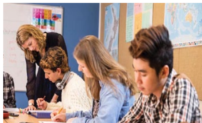
Salle de cours