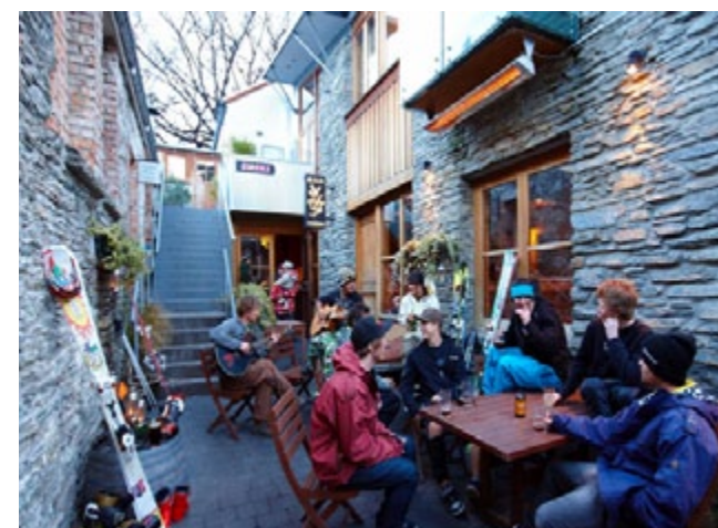
Étudiants en station de ski