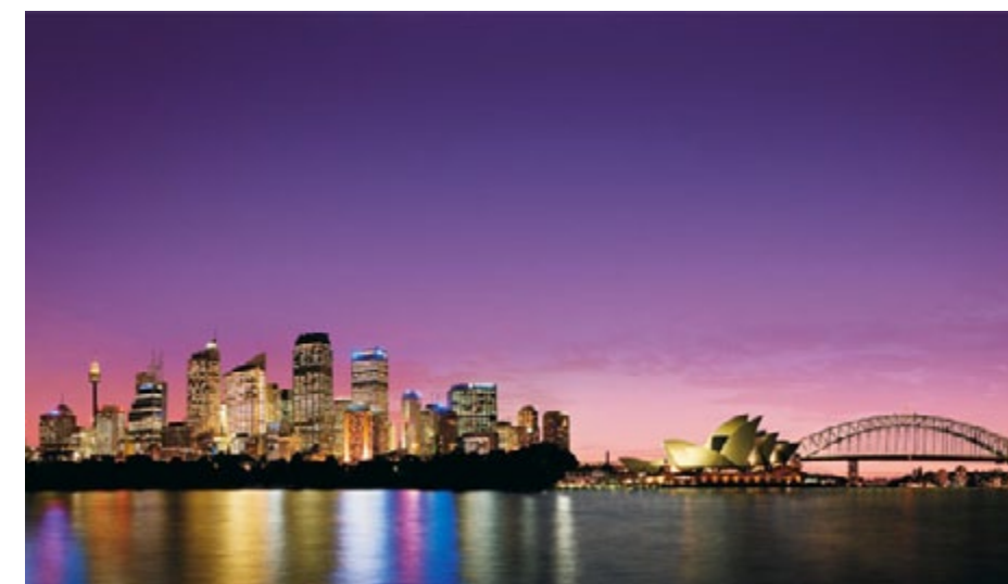
Sydney Opera House et Harbour Bridge

A votre arrivée, vous intégrerez directement la famille qui vous a été attribuée. A l'issue de votre séjour en demi-pair, vous continuez de bénéficier de votre adhésion à l'organisme de placement. Aussi, si vous le souhaitez, vous serez en mesure de poursuivre en Au pair uniquement.