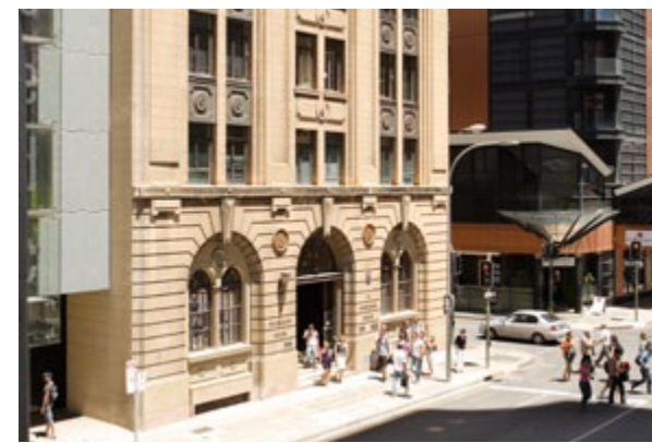
Entrée de l'école