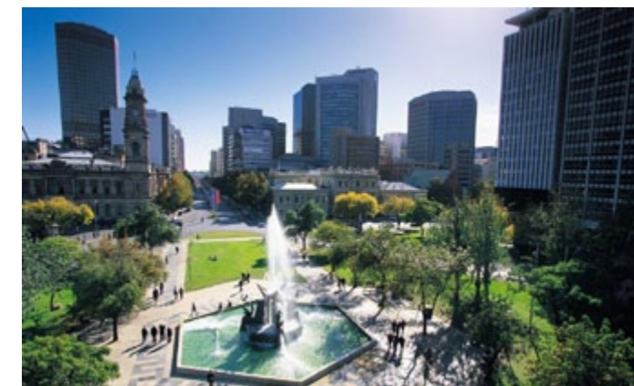
Adelaide Park Lands