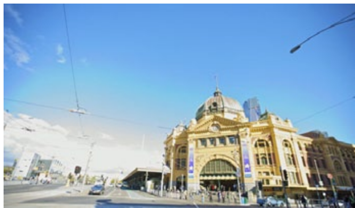
Flinders St Station