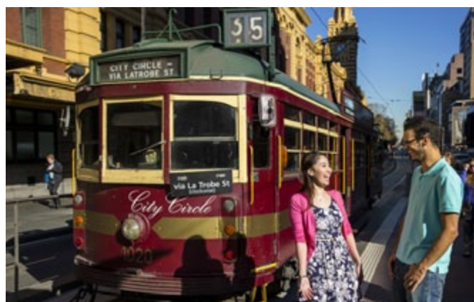
Tramway, the City Circle