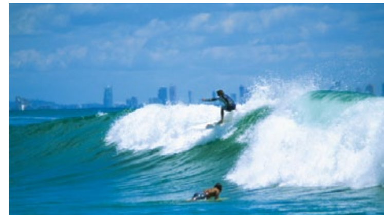
Vue de Surfers Paradise, Australie