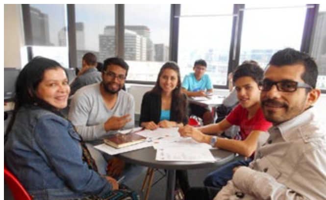
Salle de cours