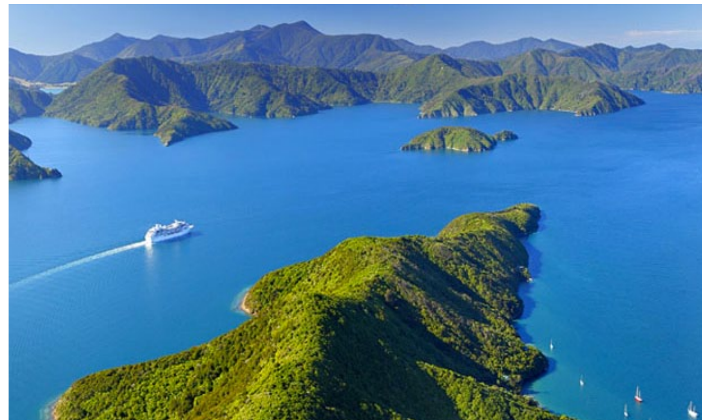
Fiordland National Park