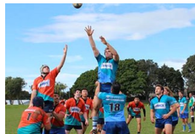
Joueur de rugby