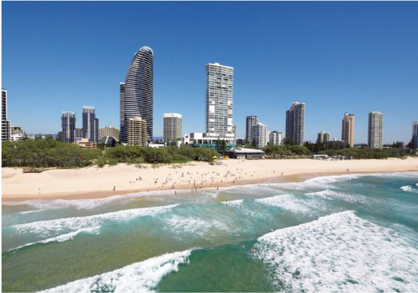
Gold Coast, Australie