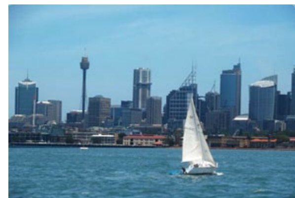
Sydney skyline, Australie