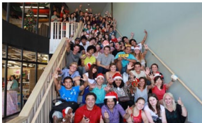
Étudiants à Noël