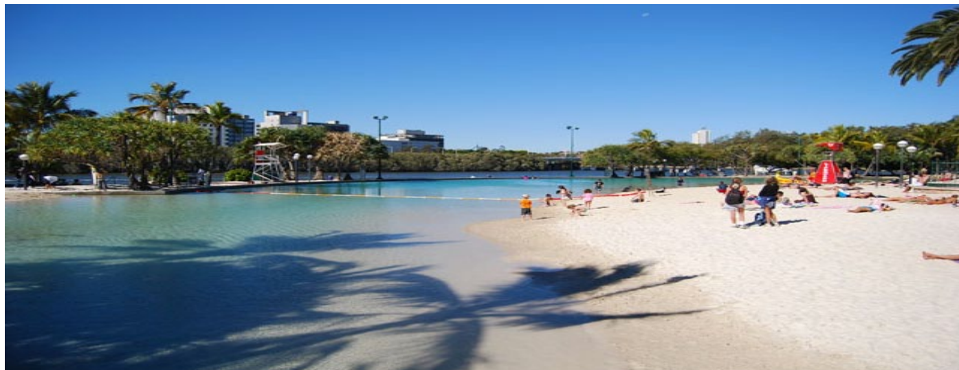
The lagoon, Brisbane

A votre arrivée, vous intégrerez directement la famille qui vous a été attribuée. A l'issue de votre séjour en demi-pair, vous continuez de bénéficier de votre adhésion à l'organisme de placement. Aussi, si vous le souhaitez, vous serez en mesure de poursuivre en Au pair uniquement.