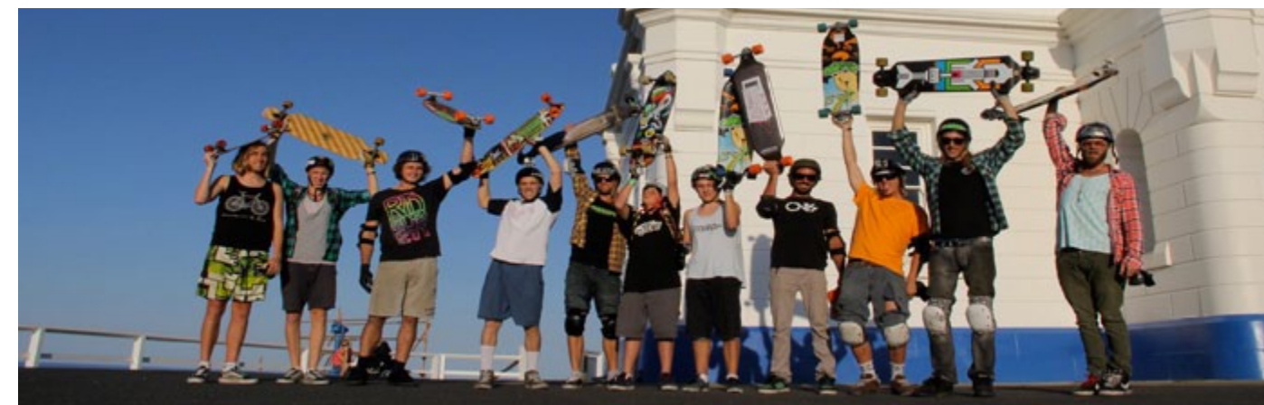
Étudiants au phare de Byron Bay