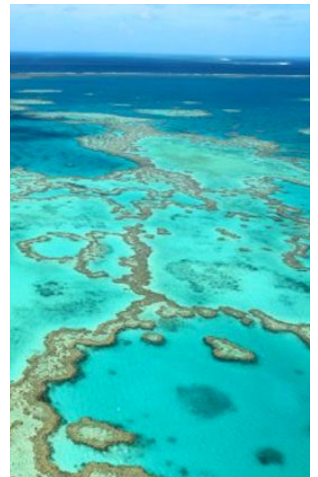
Grande barrière de corail, Australie